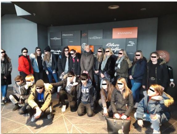
Die Klasse 6a mit Schauspielerin Cordula Stratmann

Anschließend haben wir uns vor dem Kino zum Gruppenfoto aufgestellt und auf Cordula Stratmann gewartet, die sich dann mitten in unsere Gruppe zum Foto hinstellte.